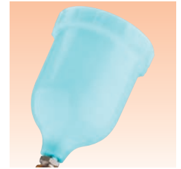
Fließbecher für schwierige Beschichtungsstoffe (Polyester blau) Bestell Nr. GFC-511