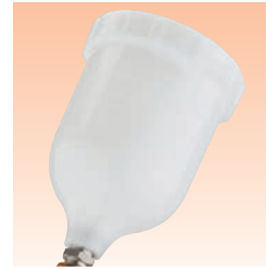
Fließbecher Bestell Nr. GFC-501